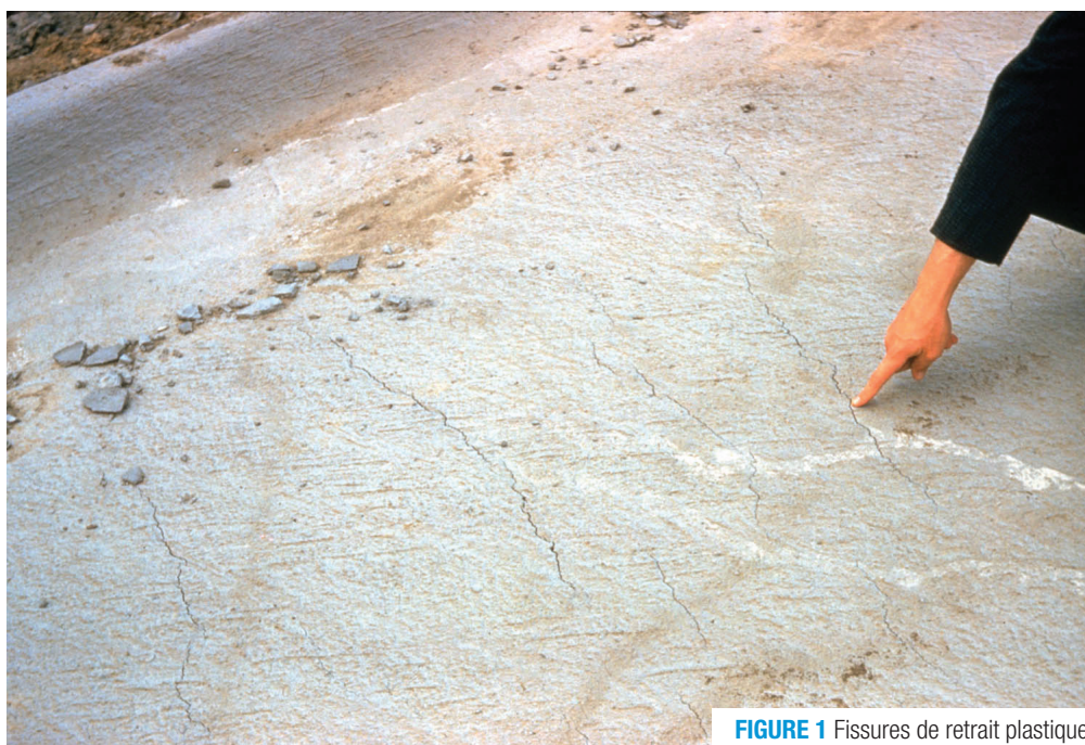
FIGURE 1 Fissures de retrait plastique

Note : il existe des fissures de retrait qui se produisent à l'état plastique et qui sont reliées au tassement du béton.