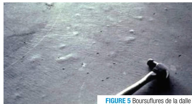
FIGURE 5 Boursouflures de la dalle

Lorsque des boursouflures sont détectées pendant que le béton est encore frais, l'utilisation d'un aplanisseur en bois peut permettre de libérer l'air et l'eau obstrués sous la surface du mortier. Lorsque le béton est durci, les boursouflures se brisent sous l'action de la circulation en formant des dépressions de surface d'environ 3 mm de profondeur.