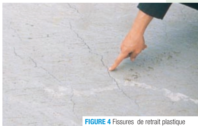
FIGURE 4 Fissures de retrait plastique

Ce phénomène est provoqué lorsque l'eau de surface s'évapore plus rapidement que celle qui monte à la surface durant le processus naturel de ressuage du béton. Il en résulte alors de petites fissures irrégulières. Le sujet des fissures a fait l'objet d'un bulletin technique spécifique 6 .