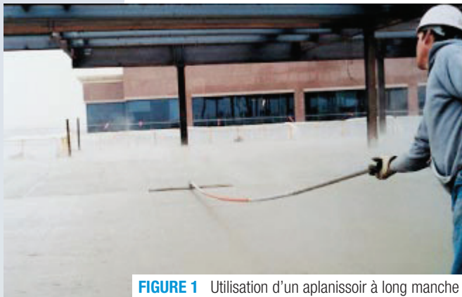
FIGURE 1 Utilisation d'un aplanisseur à long manche

Les aplanisseurs et les truelles d'acier sont à proscrire avec un béton à air entrainé. Pour certaines dalles, il faut procéder à des opérations supplémentaires de façonnage des bords et des joints, de talochage, de truillage et de la réalisation d'une texture afin de compléter la finition.