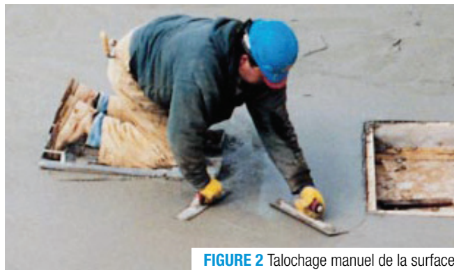
FIGURE 2 Talochage manuel de la surface

Il est interdit de saupoudrer du ciment sur la surface pour absorber l'excès d'eau, car ce procédé provoque le faïençage 3 . La taloche manuelle doit être tenue à plat sur la surface du béton et déplacée avec un léger mouvement de va-et-vient en un ample arc de cercle dans le but de combler les creux et lisser les crêtes (figure 2). Le talochage des grandes dalles s'effectue habituellement avec des talocheuses mécaniques, soit la truelleuse mécanique rotative avec les palles à plat afin de ne pas fermer la surface. Ceci permet de réduire le temps d'exécution de l'opération. Le talochage mécanique débute lorsque le béton peut supporter le poids d'une talocheuse mécanique sans qu'il y ait altération du nivellement de la surface.