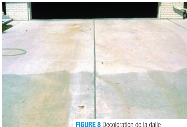
FIGURE 8 Décoloration de la dalle