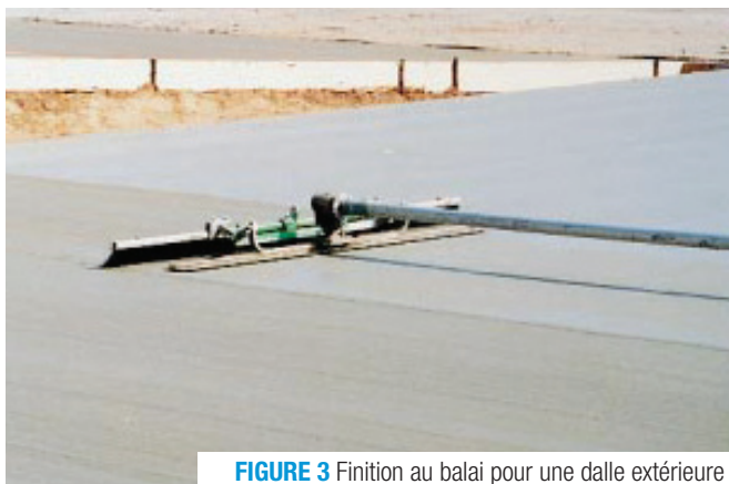
FIGURE 3 Finition au balai pour une dalle extérieure

Divers motifs et textures peuvent être utilisés pour produire des finis décoratifs et esthétiques. Il est possible d'estamper des motifs produisant des surfaces similaires à la pierre naturelle, à la brique ou à d'autres matériaux de construction naturels. Également, une surface attrayante et rugueuse peut être obtenue en exposant les granulats du béton. La réalisation de motifs et de textures doit être accomplie par des entrepreneurs spécialisés et expérimentés. Pour assurer le meilleur rendement de la méthode utilisée, il est recommandé d'effectuer des essais sur des planches témoins.