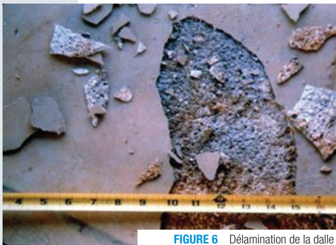
FIGURE 6 Délamination de la dalle

La délamination des surfaces de béton est produite par une action similaire à l'apparition des boursouflures. L'air et l'eau entravés sous le mortier de surface provoquent une délamination de la surface de la dalle de béton variant de quelques centimètres à quelques mètres carrés (figure 6). L'épaisseur de délamination de la dalle peut varier de 3 à 5 mm. La délamination est apparente lorsque le béton est durci et que la surface se détériore sous l'action de la circulation. Un relevé de délamination peut être effectué à la surface du béton durci par la méthode Impact-Écho ou encore en passant une chaîne à maille et en observant les changements de sons.