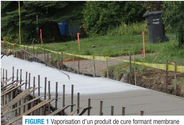
FIGURE 1 Vaporisation d'un produit de cure formant membrane

Les produits de cure formant une membrane sont composés de cire, de résines, de caoutchouc chloré et de solvants très volatils et servent à réduire ou à retarder l'évaporation de l'eau du béton. Ils doivent être appliqués rapidement sur le béton frais ou sur les surfaces de béton après le décoffrage. De plus, ces produits doivent être vaporisés manuellement ou mécaniquement, en respectant le taux d'application recommandé par le fabricant, et être appliqués au moment opportun (figure 1). Leur utilisation est à éviter pendant la période de ressuage du béton.