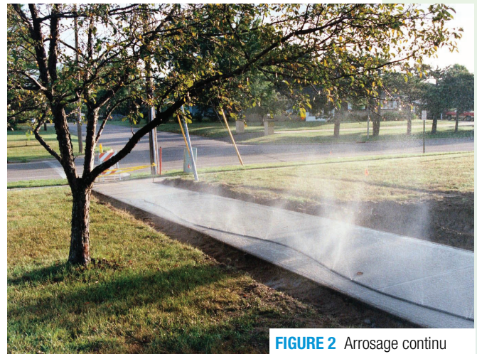
FIGURE 2 Arrosage continu

Les toiles imbibées d'eau sont faites de coton, de jute, de géotextiles ou d'autres matières capables de retenir l'eau et sont fréquemment utilisées. Les toiles doivent être exemptes d'apprêt ou d'autres substances incompatibles avec le béton ou qui peuvent le décolorer. Elles doivent être maintenues continuellement humides durant la période de cure afin d'éviter d'absorber l'eau du béton. Une pellicule de polyéthylène recouvrant la toile diminue le nombre d'arrosages et peut être utilisée lorsqu'un arrosage soutenu est optionnel pour refroidir le béton.