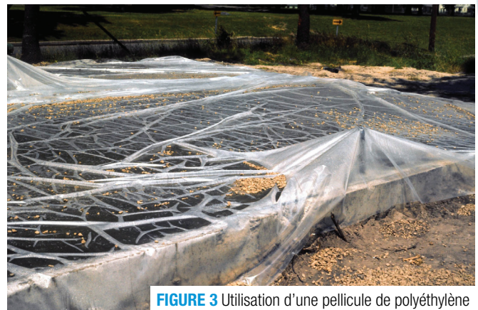
FIGURE 3 Utilisation d'une pellicule de polyéthylène

L'utilisation de pellicules de plastique ou de papiers imperméables peut s'avérer suffisante sur des surfaces horizontales ou sur des bétons structuraux ayant des formes simples (figure 4). Ces méthodes diminuent le besoin d'apport d'eau continu et assurent une hydratation adéquate du ciment en empêchant l'eau de s'évaporer. Elles sont à éviter lorsque les surfaces apparentes du béton sont importantes, ainsi que par temps chaud à cause de l'effet de serre. Si le papier imperméable est abîmé pendant la période de protection, il faut réparer et sceller la partie endommagée.